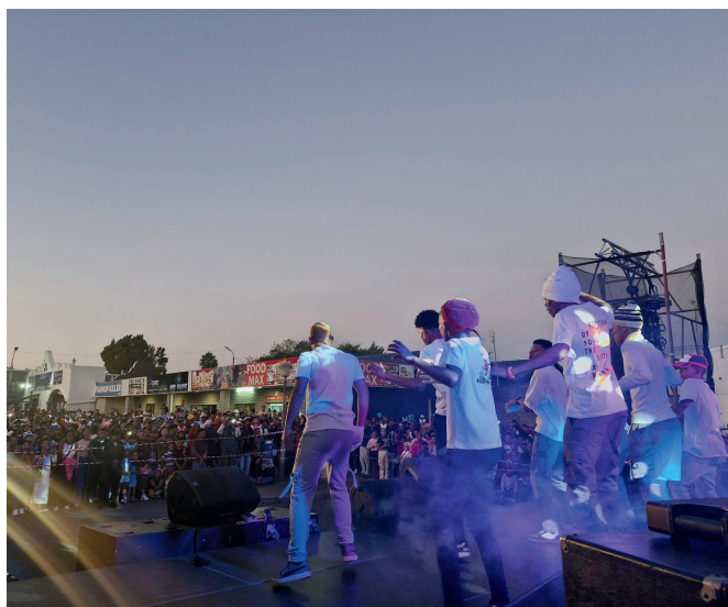
FOTO: Plaaslike dansgroep, the Ultimates, tree op by die Kersmark.