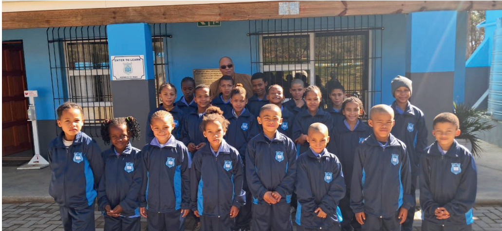
FOTO: Byna 400 plaaslike skoolleerders trek voordeel uit 'n winteruniform-insameling.