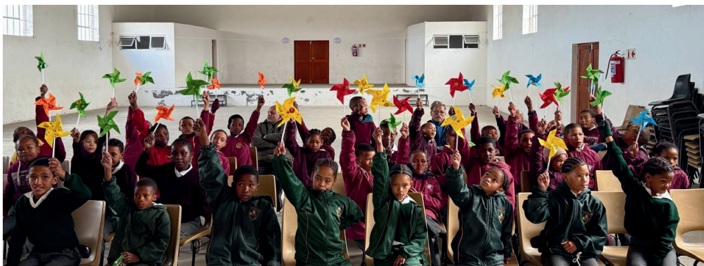
Plaaslike laerskoolleerders vier Global Wind Day.

Die dag is afgesluit met 'n prettige vasvra, pryse, geskenksakkies en middagete.