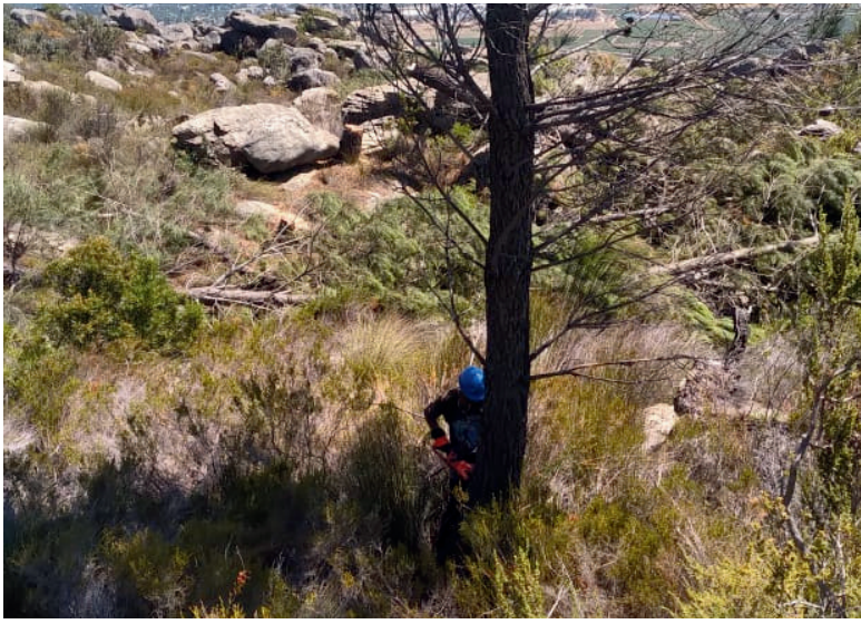
FOTO: Die Skoonveld-program bemagtig die jeug en gemeenskappe terwyl die omgewing bewaar word.