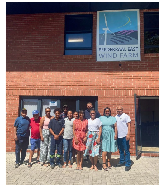
FOTO: Plaaslike entrepreneurs bemagtig deur besighedsopleiding.

Ons het ook ses klein besighede opgelei in die basiese beginsels van boekhouding, finansiële bestuur en HR-beginsels, wat entrepreneurs die hulpmiddels gee wat hulle nodig het om te floreer.